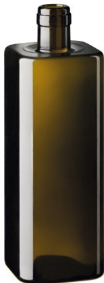
OASIS 50 CL