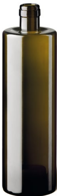
DELTA 75 CL