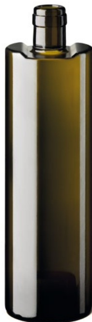
SAVANNAH 75 CL

BOTELLA BERONESA S.L. INFORMACIÓN Y VENTA: 635 22 37 85